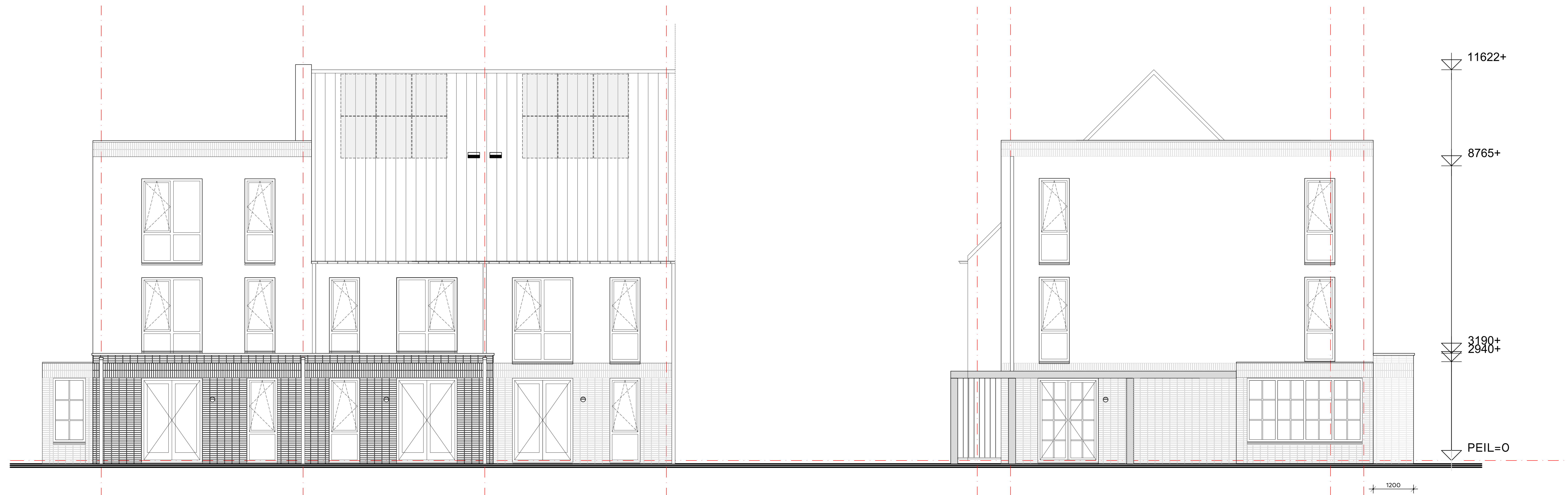
Achtergevel (optie achteruitbouw 1200mm) Parkwoningen (blok 1 en 2) + bnr. 20