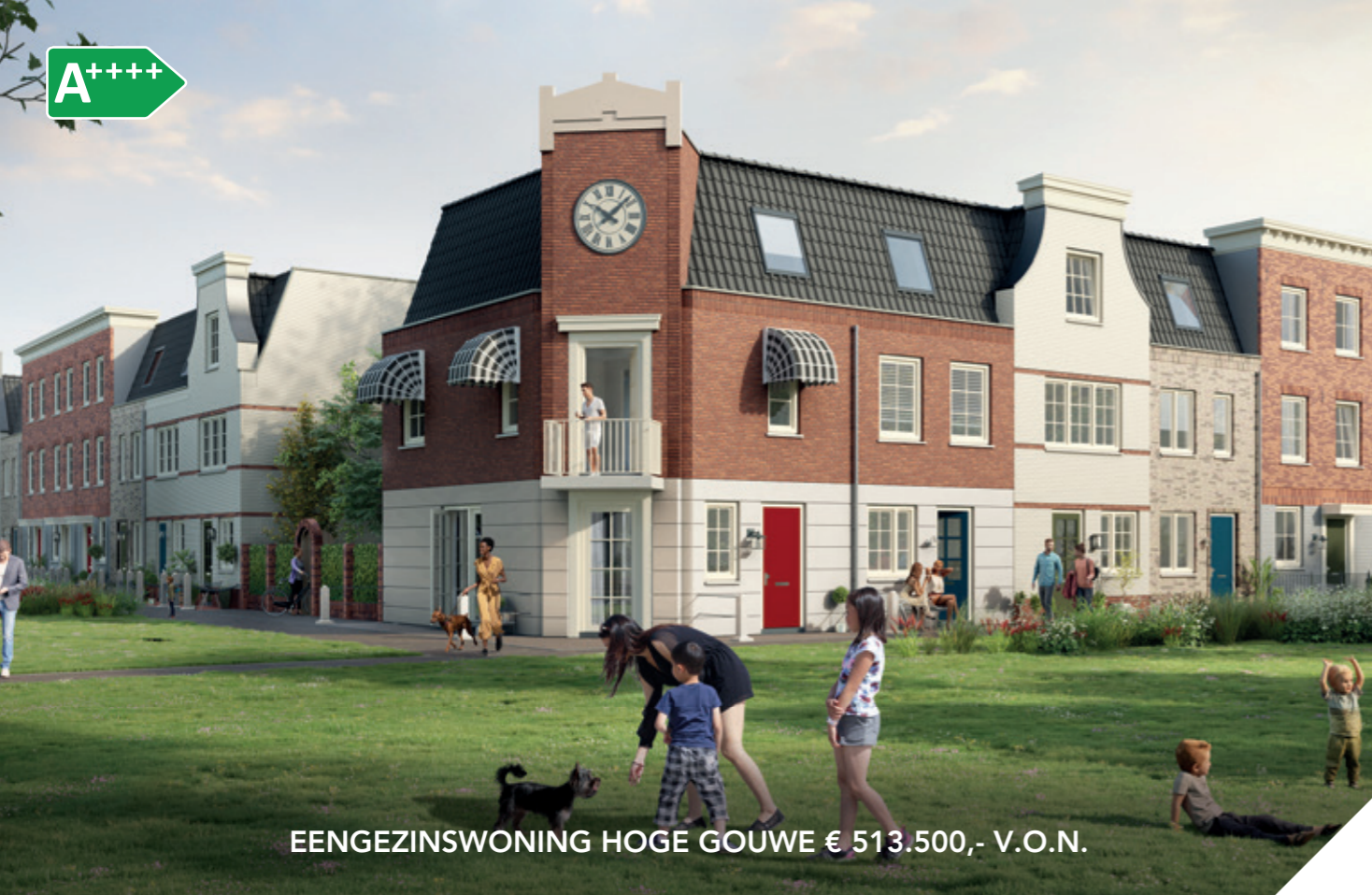
EENGEZINSWONING HOGE GOUWE € 513.500,- V.O.N.