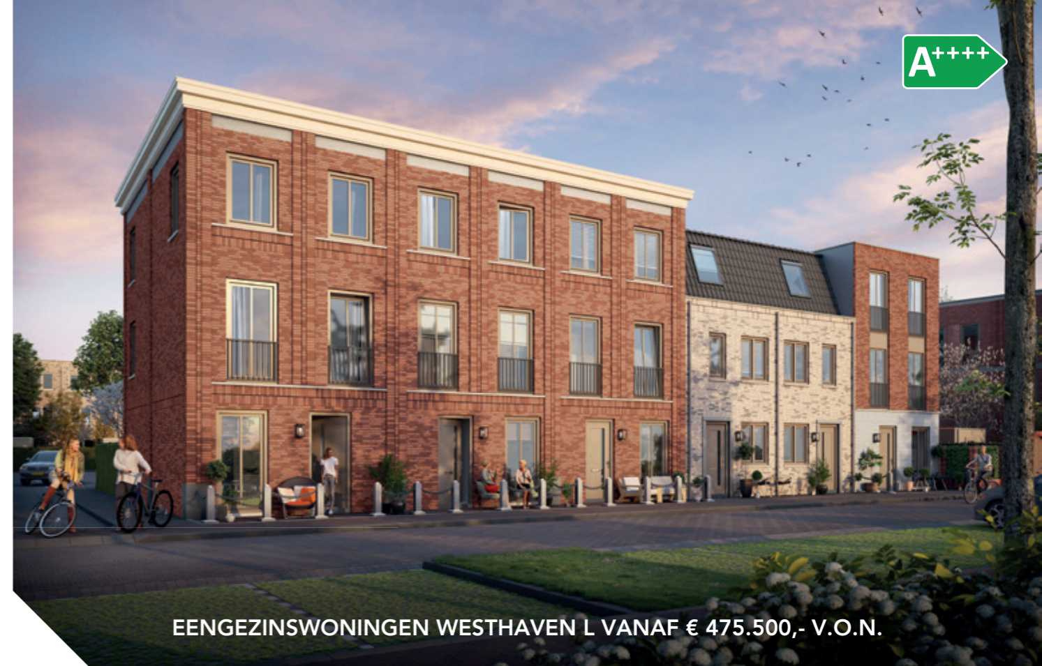
EENGEZINSWONINGEN WESTHAVEN L VANAF € 475.500,- V.O.N.